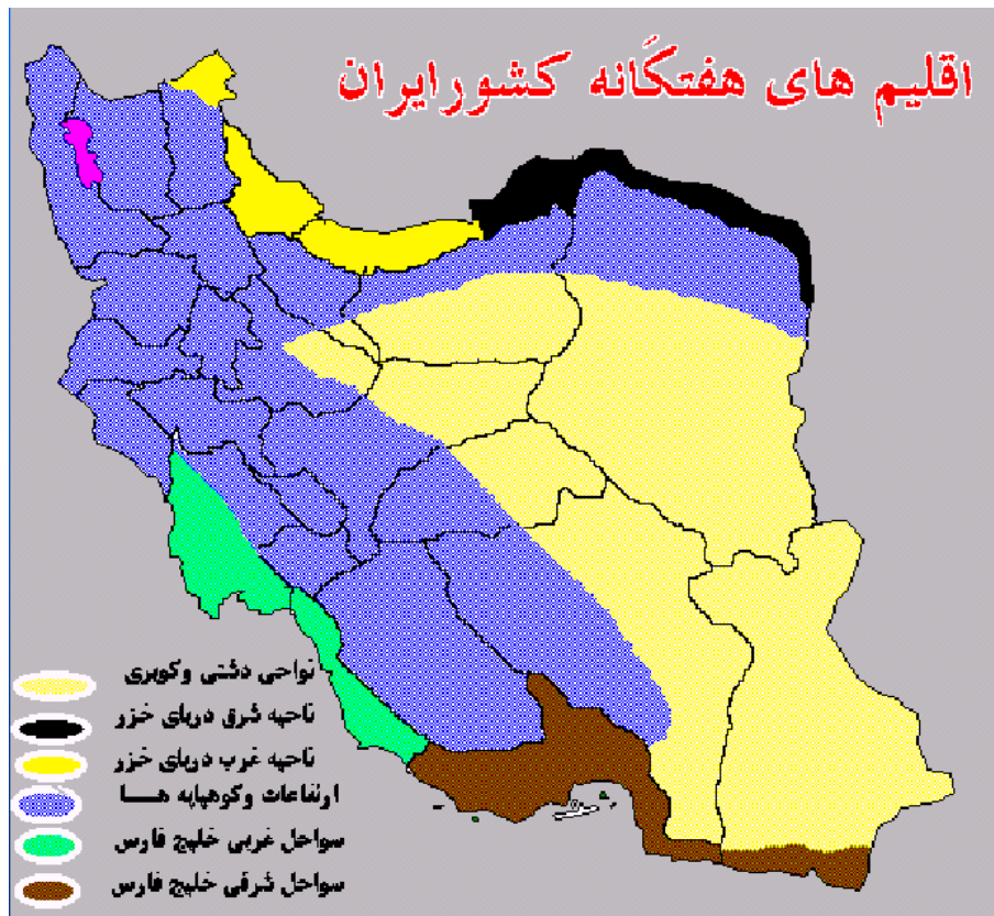
نقشه ۱ - اقلیم‌های هفتگانه ایران.

۱) در منطقه غربی و مرکزی دریای خزر، استرانژیلولوئیدیازیس، نکاتوریاژیس، آنکیلوستومیازیس، فاسیولیازیس، تنیاساژیناتا، تریکوسفال، هاری، تریشینلوز، تنیاسولیوم، لارو مهاجر احشایی، مایستوما، کریپتوکوکوزیس، مالاریا، توکسوپلاسموز و لپتوسپیروز قبلاً وجود داشته و یا در حال حاضر نیز وجود دارد.