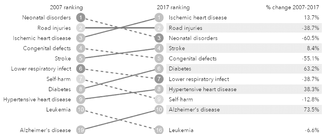
شکل ۳ - بیماری‌هایی که در ایران بیشترین ناتوانی را ایجاد می‌کنند (مقایسه سال ۲۰۰۷ با ۲۰۱۷)

شیوع اختلالات روانی، تابع مجموعه‌ای از عوامل زیستی، روانی و اجتماعی است. شیوع اختلالات روانی بخصوص افسردگی در ایران قابل توجه است. طبق آخرین مطالعه همه‌گیرشناسی، شیوع دوره‌ای یکساله در ایران ۲۳٫۶ درصد بوده است. در مطالعات سابق، این میزان اندکی کمتر بوده است. ولی نسبت بار بیماری ناشی از افسردگی و اضطراب و میزان رشد سالانه آن در ایران از میانگین جهانی بالاتر است (جدول ۱). در شکل ۳ تغییرات رتبه اختلالات روانی در میان سایر بیماری‌ها از نظر بار بیماری‌ها در ایران با توجه به سال‌های ازدست رفته به علت ناتوانی مقایسه شده است. همانطور که ملاحظه می‌شود در مقایسه درون کشوری نیز افسردگی در حال افزایش بوده است.