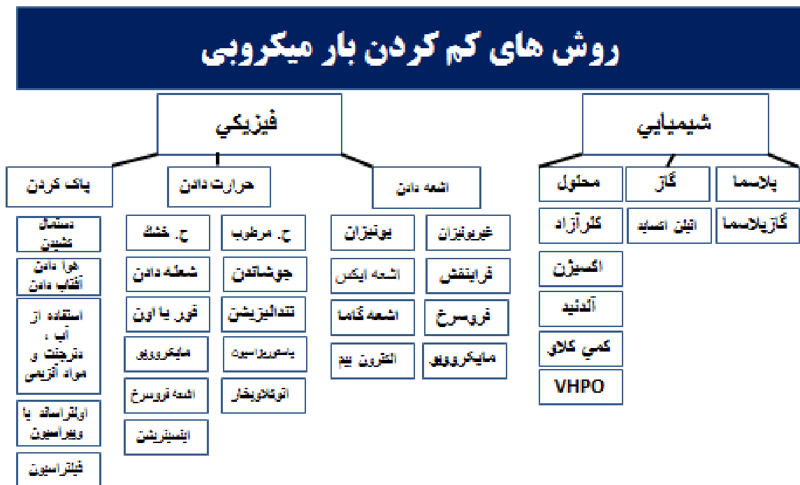
شکل ۱ - روش های کم کردن بار میکروبی

این روش ها به دو دسته فیزیکی و شیمیایی تقسیم می شوند و در تصویر شماره یک آورده شده اند.